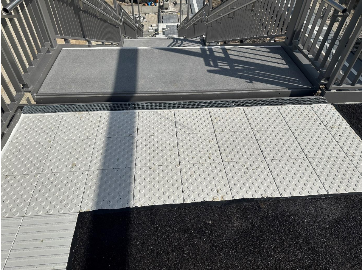
Abbildung 3: Haltepunkt Reutlingen RTunlimited: Treppenbelag aus Betonstufen und Gussasphaltbelag