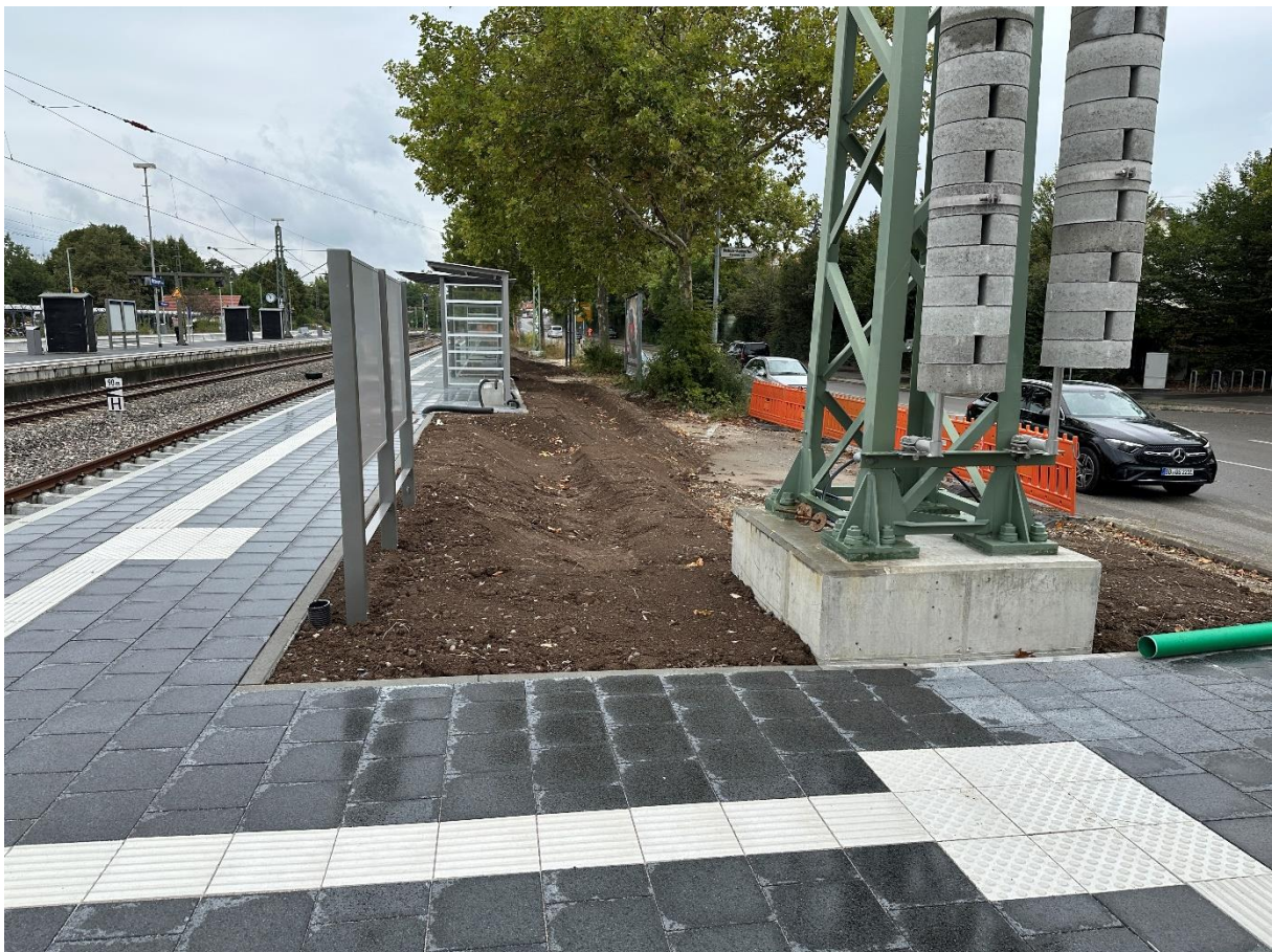
Abbildung 2: Bahnhof Metzingen: Neuer Bahnsteig am Gleis 604

Der Bahnsteig am Gleis 604 wurde im Jahr 2024 größtenteils baulich fertiggestellt. Es fehlen jedoch noch die 50 Hz Leistungen (u.a. Beleuchtung) und die Bahnsteigbeschilderung. Die Anpassung des Spurplans wird im Jahr 2025 mit der Inbetriebnahme des Elektronischen Stellwerks (ESTW) abgeschlossen. Die Baufeldfreimachung konnte erfolgreich im Jahr 2024 abgeschlossen werden. Die Fortsetzung der Arbeiten an der Gleisanlage und an der Oberleitung erfordert einen Eingriff in die Stellwerkstechnik und erfolgt in einer längeren Sperrpause im Sommer 2025.