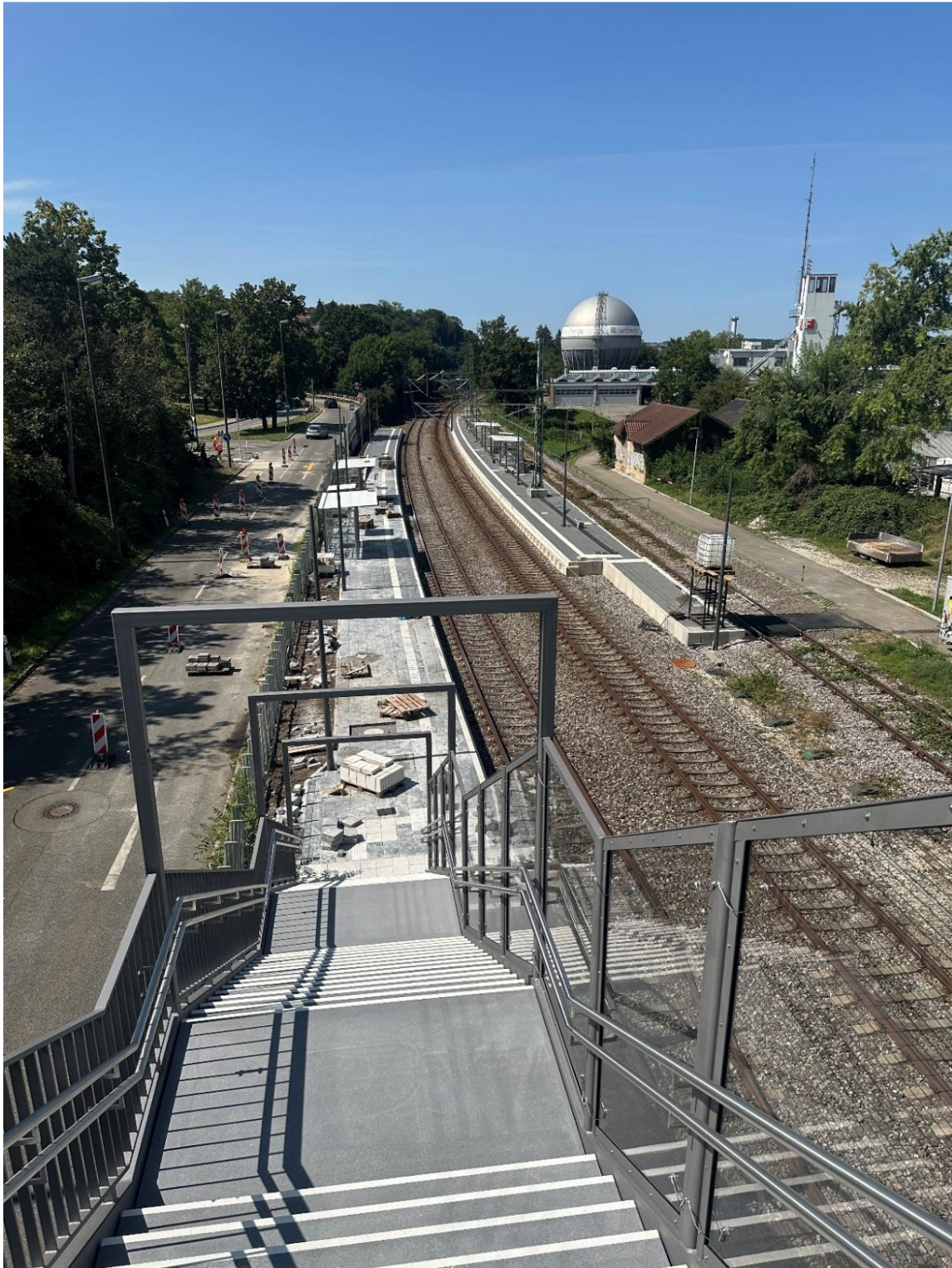
Abbildung 4: Haltepunkt Reutlingen Bösmannsäcker: Treppenabgang zum Bahnsteig 2

Für Maßnahmen an den beiden Haltepunkten auf Reutlinger Stadtgebiet sind im Wirtschaftsjahr 2025 Investitionen in Höhe von insgesamt 130.000 EUR (zzgl. Verpflichtungsermächtigungen) vorgesehen. Eine Gegenfinanzierung erfolgt durch Zuschüsse aus dem GVFG-Bundesprogramm sowie kommunale Zuschüsse zu dem Projekt Regional-Stadtbahn Neckar-Alb.